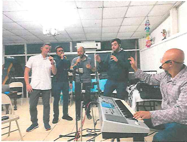
Ensayo del ensamble vocal