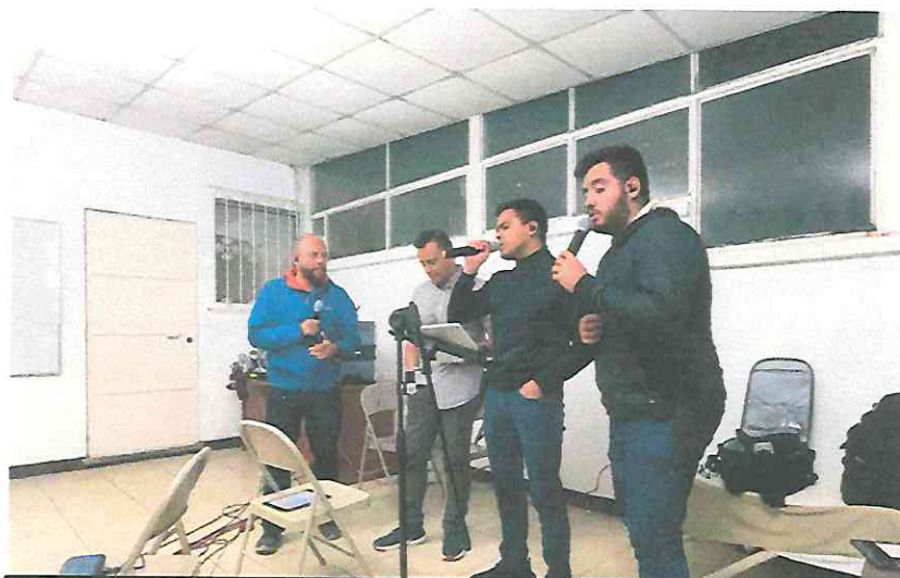
Ensayo de Repertorio lunes 03 de julio 2023