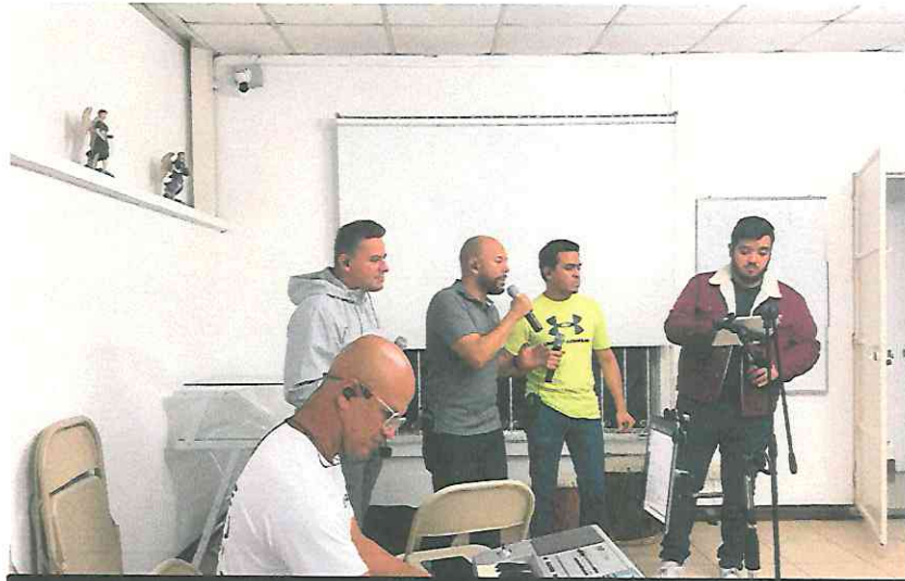
Ensayo de Repertorio jueves 29 de junio 2023