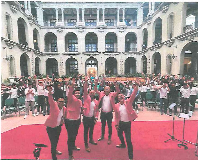
Despedida del concierto