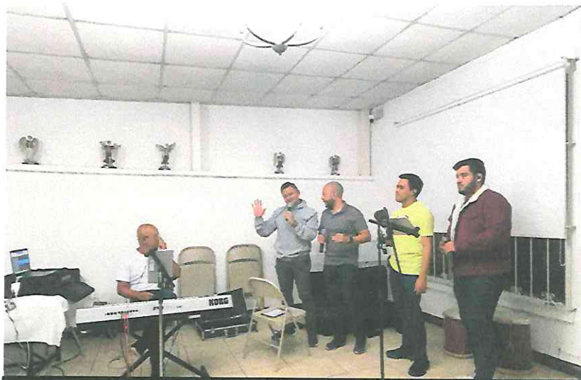
Ensayo de Arreglos jueves 29 de junio 2023