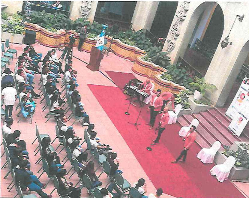
Interpretando "Una Sola Vez"