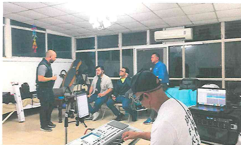
Ensayo de Arreglos lunes 19 de junio 2023