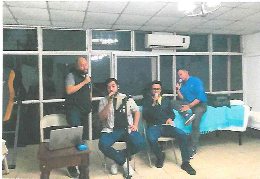
Ensayo de Repertorio lunes 19 de junio