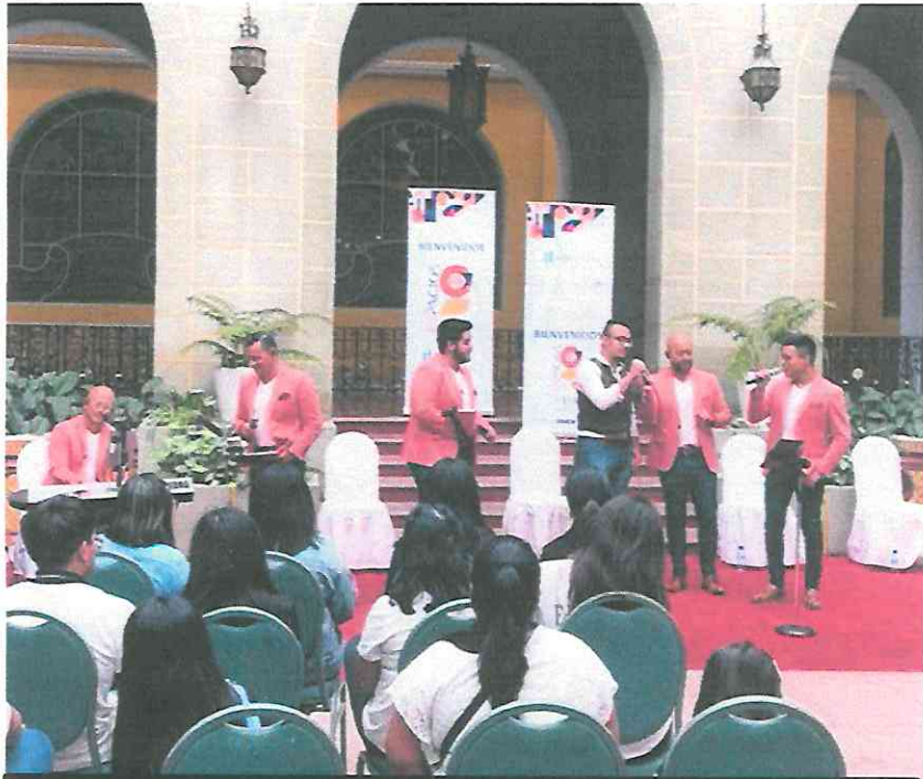
Interacción con el publico asistente