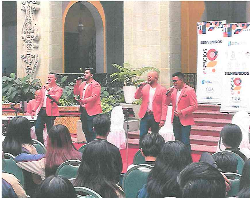
Interpretando "El Grito"