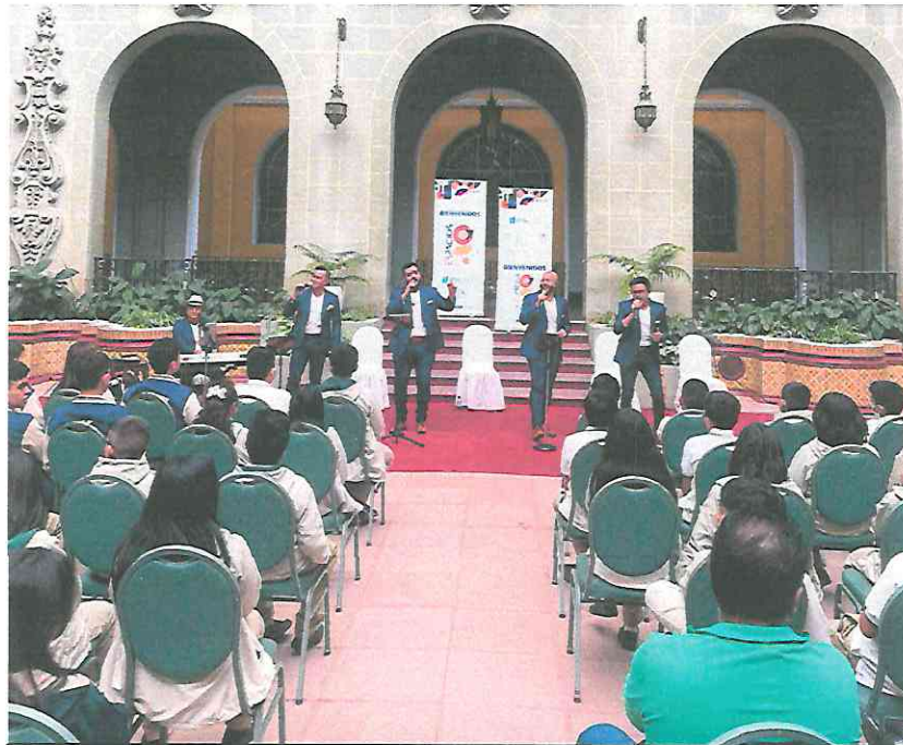
Interpretando “La Niña De Guatemala”