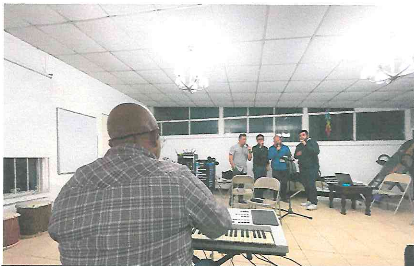
Ensayo de Arreglos lunes 03 de julio 2023