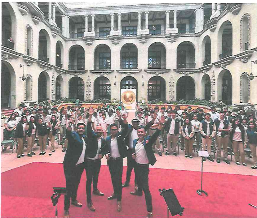
Despedida del concierto