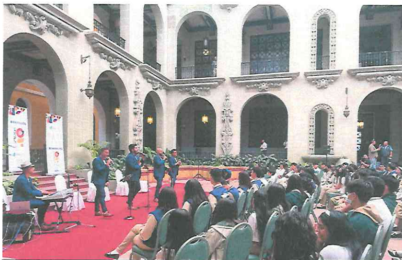
Interpretando “Luna de Xelajú”