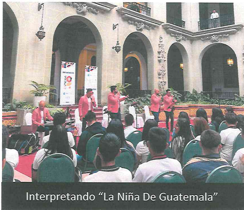
Interpretando "La Niña De Guatemala"