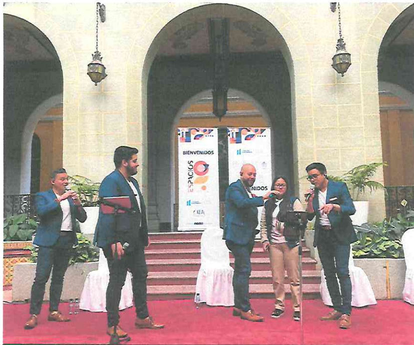
Interacción con el público asistente